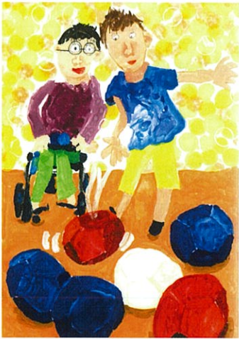
令和5年度 「障害者週間のポスター」